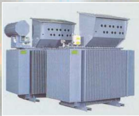
Transformateur de distribution Primaire: 20 000V - Secondaire: 410V Puissance: 1 600 kVA