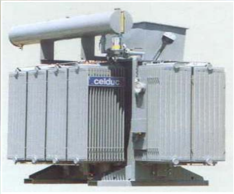
Transformateur de forte puissance Primaire: 15 750V - Secondaire: 3 200V Puissance: 1 000 kVA