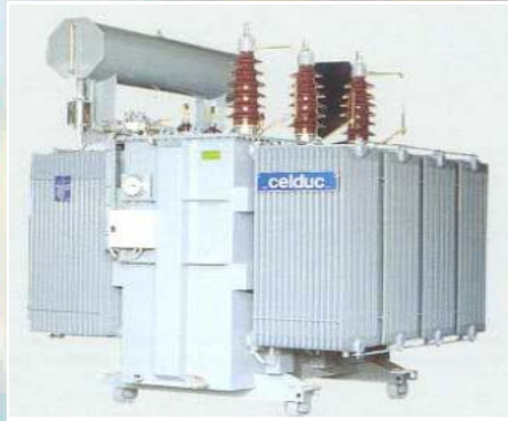
Transformateur de forte puissance Primaire: 63 000V - Secondaire: 5 800V Puissance: 6 300 kVA