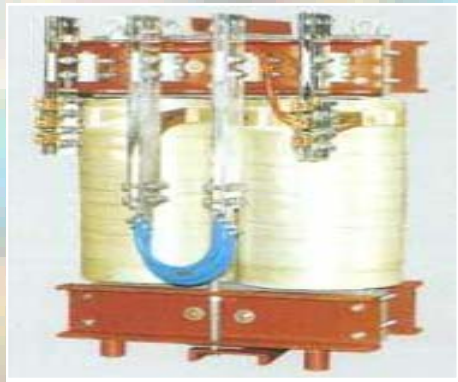
Self à l'eau 0,6mH 2 825A