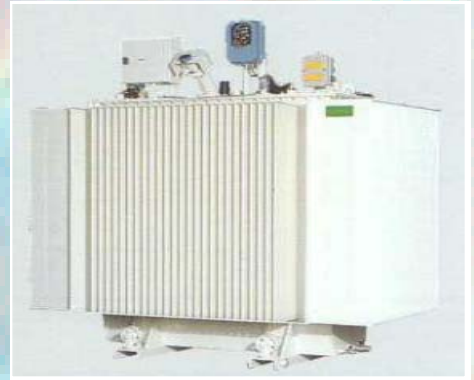
Self de compensation 21 000V Puissance: 3 000 kVAR