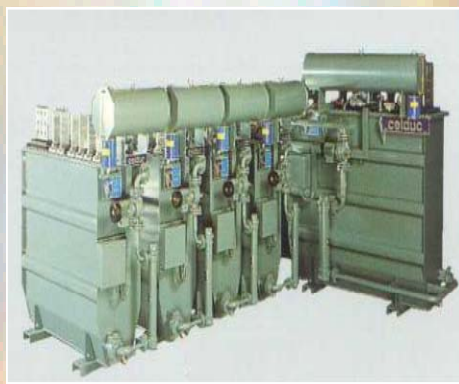
Transformateur à double secondaire Primaire: 6 000V - Secondaire: 42V et 60V Puissance: 910 kVA et 2 080 kVA