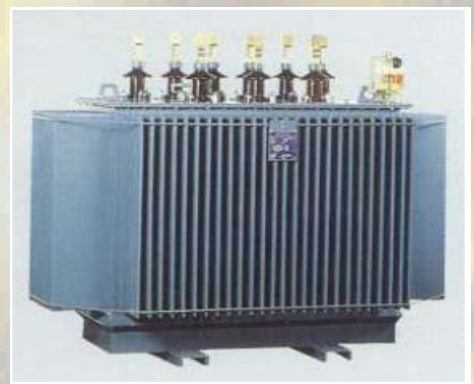
Autotransformateur de démarrage Primaire: 20 000V - Secondaire: 410V Puissance: 1 600 kVA